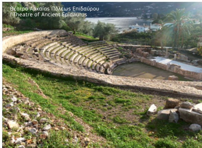
Θέατρο Αρχαίας Πόλεως Επιδαύρου / Theatre of Ancient Epidaurus