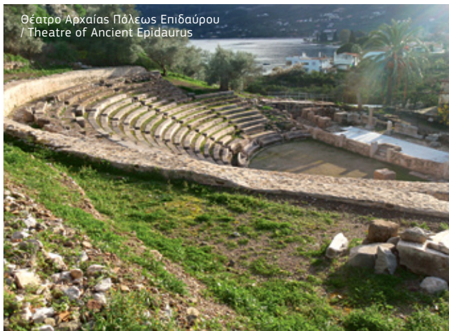
Θέατρο Αρχαίας Πόλεως Επιδαύρου / Theatre of Ancient Epidaurus