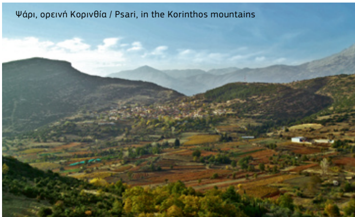
Ψάρι, ορεινή Κορινθία / Psari, in the Korinthos mountains

INFO: www.ellet.gr , www.monopatiapolitismou.gr